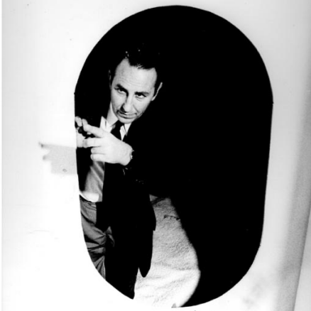
Fabio Mauri nella Luna, Roma, 1968.